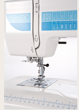
送布齒升降功能 切線器裝置