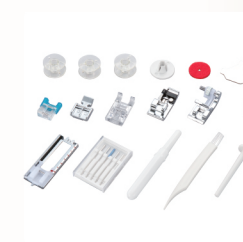
eIna 2600 專屬配件組